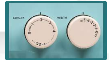
- Selector largo y ancho de puntada-