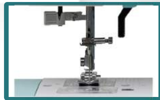
- Prénsatelas extra-altura -