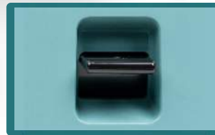
- Palanca de retroceso -